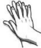
4. Suglaudžiami delnai, supinami pirštai ir trinami.