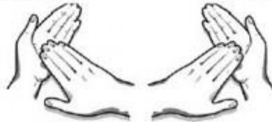
7. Sukamais judesiais trinamas kiekvienos rankos delnas.